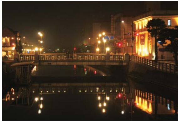
表紙の写真 「橋のある風景 8」