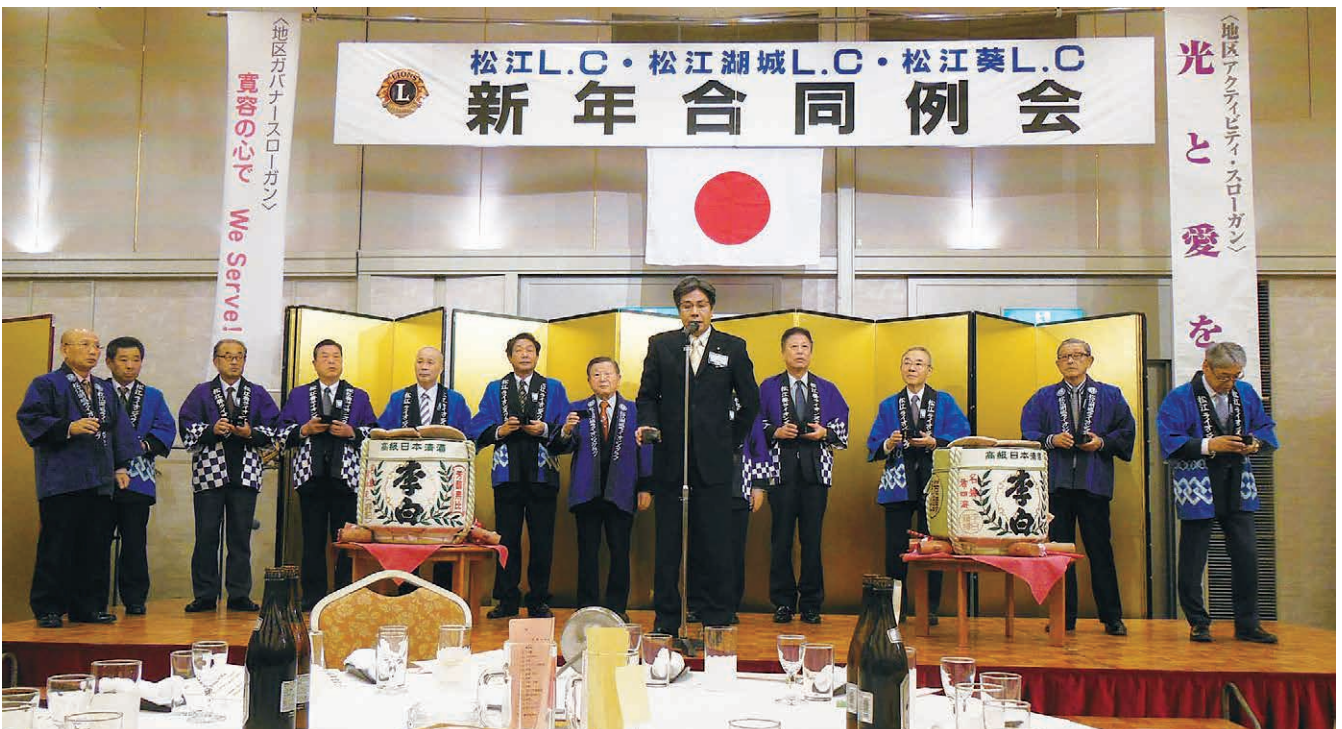
松江葵LC 日野会長 乾杯のあいさつ