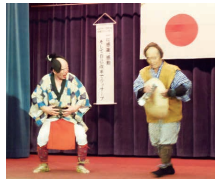
余興での「さいとりさし」