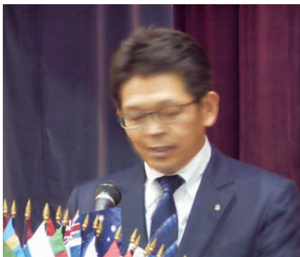
古志野第一副会長