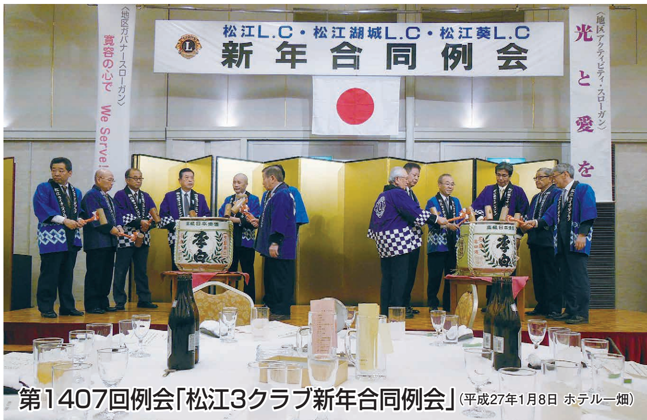
第1407回例会「松江3クラブ新年合同例会」(平成27年1月8日 ホテル一畑)