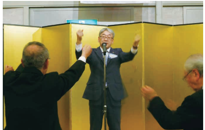
竹田会長のライオンズローア