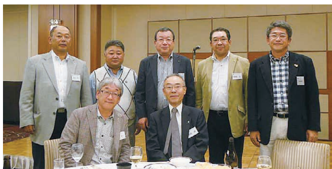
松江LC三役 広島鯉城LC三役 坂根前地区ガバナー