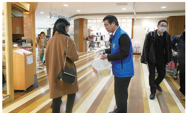
バレンタインデー献血推進キャンペーン