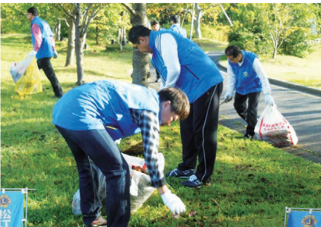
世界ライオンズ奉仕デー清掃活動