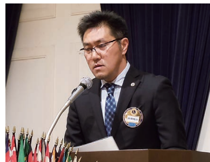
C班代表 L.経種 テーマ「松江LCの出席率向上」