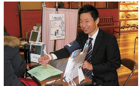
L.實重は受付終了5分前に滑り込み献血