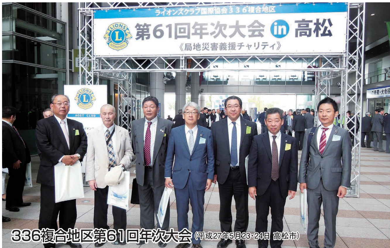
336複合地区第61回年次大会 (平成27年5月23・24日 高松市)