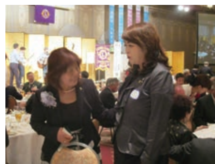
L.阪上によると似た者同士?