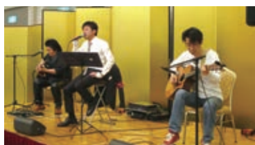
祝宴中のアトラクション HIVESさまによるバンド演奏