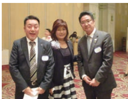
一嵐 宝塚LC会長を囲んで