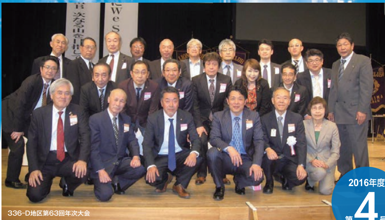
336-D地区第63回年次大会