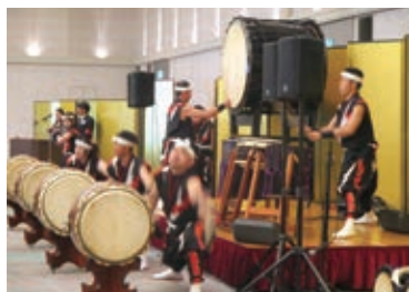
祝宴開幕の仁多乃炎太鼓