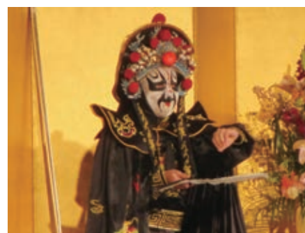
例会と祝宴の間のマジックショー