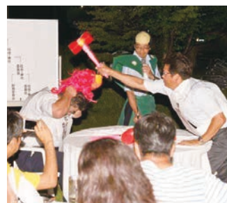
情報・指導力委員会 VS 社会・奉仕委員会