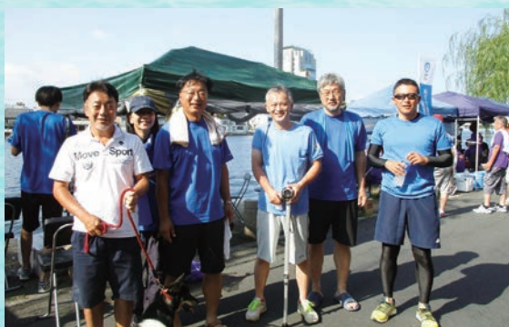
Bチーム 30日はL.松浦からL.原になぜか乗り替わりました。