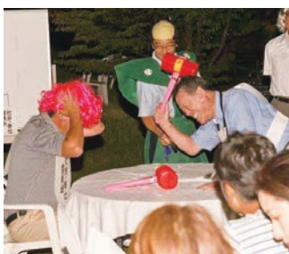
財務委員会 VS 社会・奉仕委員会