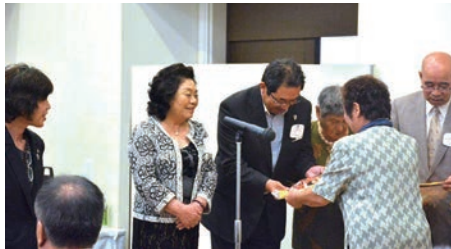
秋田ガバナーより336-D地区1R2Zの各会長へバナーの贈呈