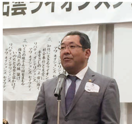
鷗鶴会長あいさつ