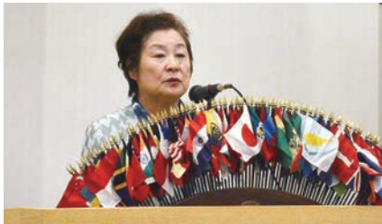
秋田千鶴地区ガバナー(浜田LC)挨拶