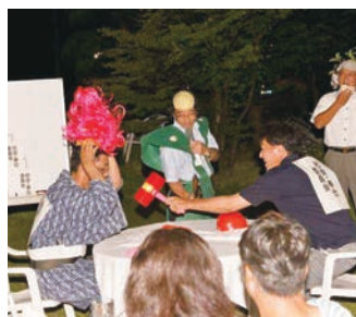
社会・奉仕委員会 VS 健康・福祉委員会