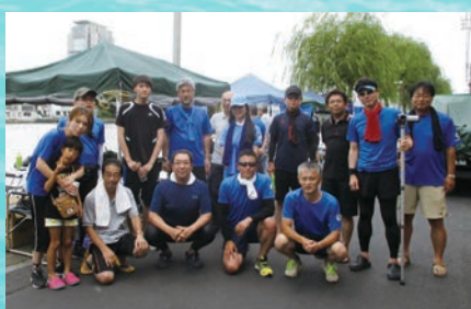
レガッタ部参加者、応援者