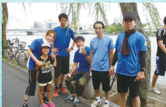
Cチーム 1～3位大接戦でしたが惜しくも3位