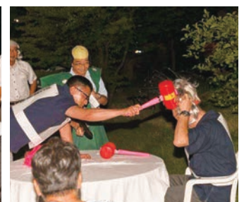
スタッフ VS MC委員会