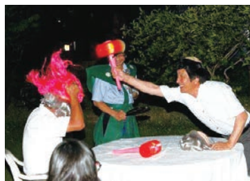
ザビエル岸本計画委員 VS 原計画委員によるデモンストレーション