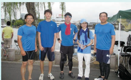
レガッタ部最強? Aチーム