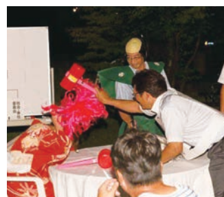
情報・指導力委員会 VS 国際・教育委員会