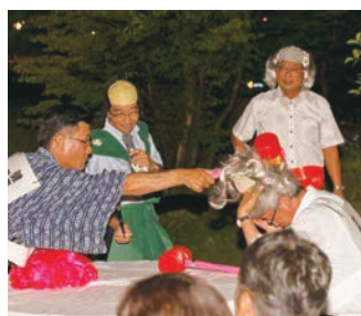
会員委員会 VS 健康・福祉委員会