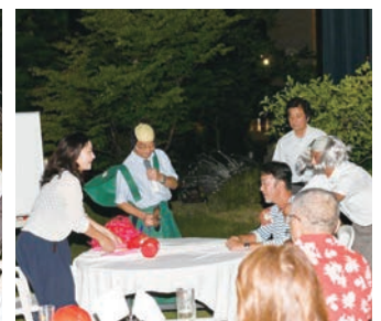
L.永原 VS LL.永原