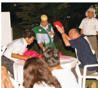
情報・指導力委員会 VS スタッフ