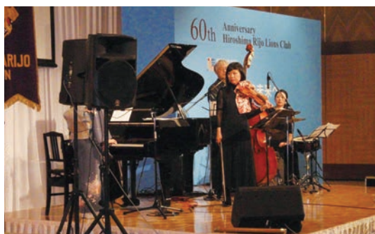
ステージ演奏 Rijoスペシャルバンド