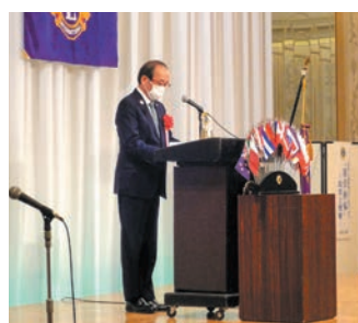
広島市長 松井一實様