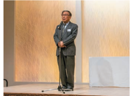
米子LC松田優待会員