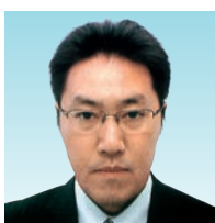
テールツイスター L.経種 順治

年が明けて会長・幹事が任期を全うした！終わった～感を出しているころ、TTとしてまだまだ長い道のりを考えてプレッシャーに耐えながら、ついに終わりの日がやってきました。