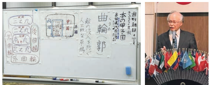
ゲストスピーチ 宍道正年歴史研究所 代表 宍道正年様